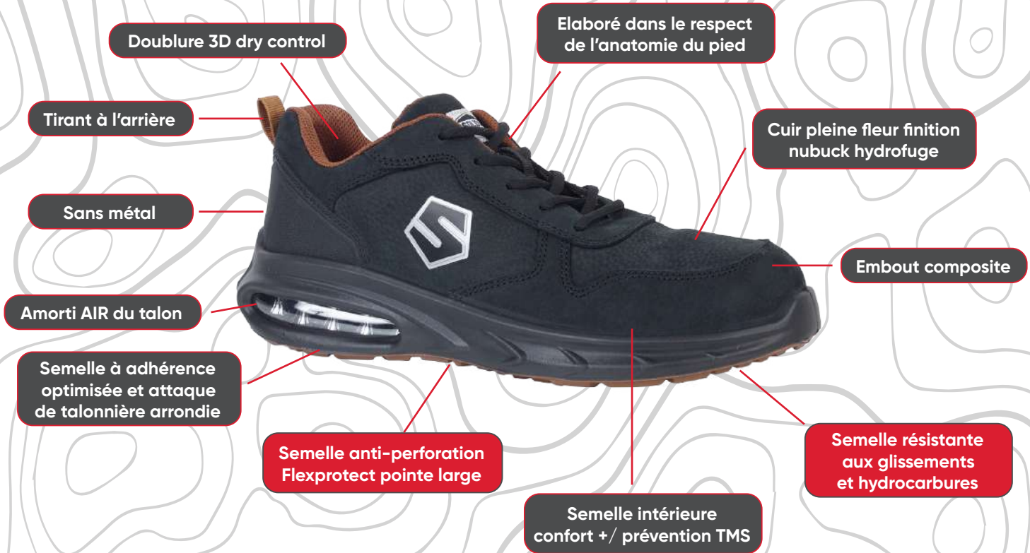
SCHÉMA DÉTAILLÉ - ARIA 03